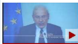
Trigilia: L'Aquila capitale dell'alta formazione