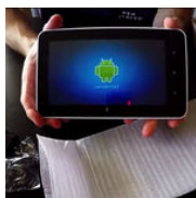
Come si fa per

eventi in programma per la Notte Europea dei Ricercatori 2015. Questo sito utilizza cookie propri e di terze parti per le sue funzionalità. Chiudendo questo banner, scorrendo questa pagina o cliccando qualunque suo elemento acconsenti all'uso dei cookie. Approfondisci