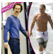
Come fanno le STAR