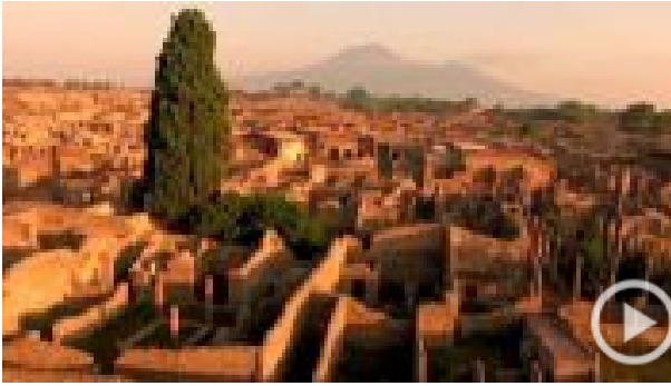
"Pompei eternal emotion", il video promo su Pompei